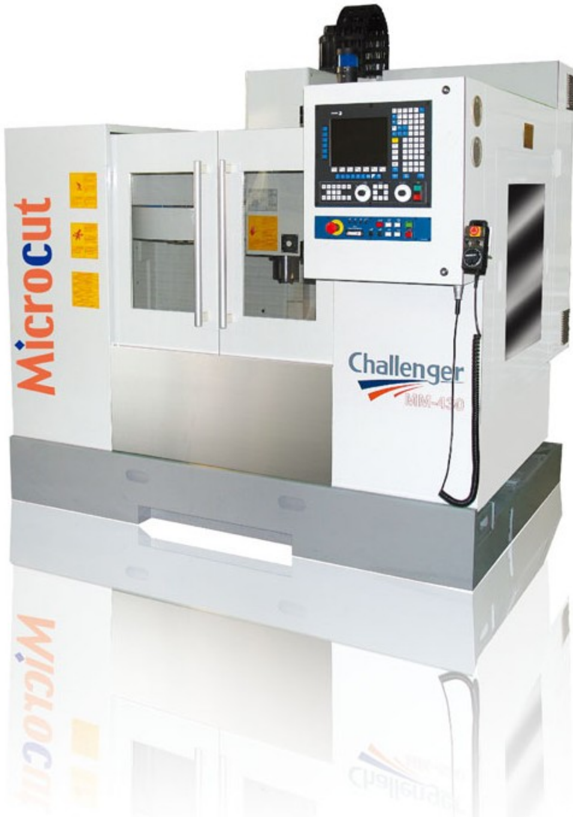
图 4.1. Profinet的CNC设备：Challenger的Microcut